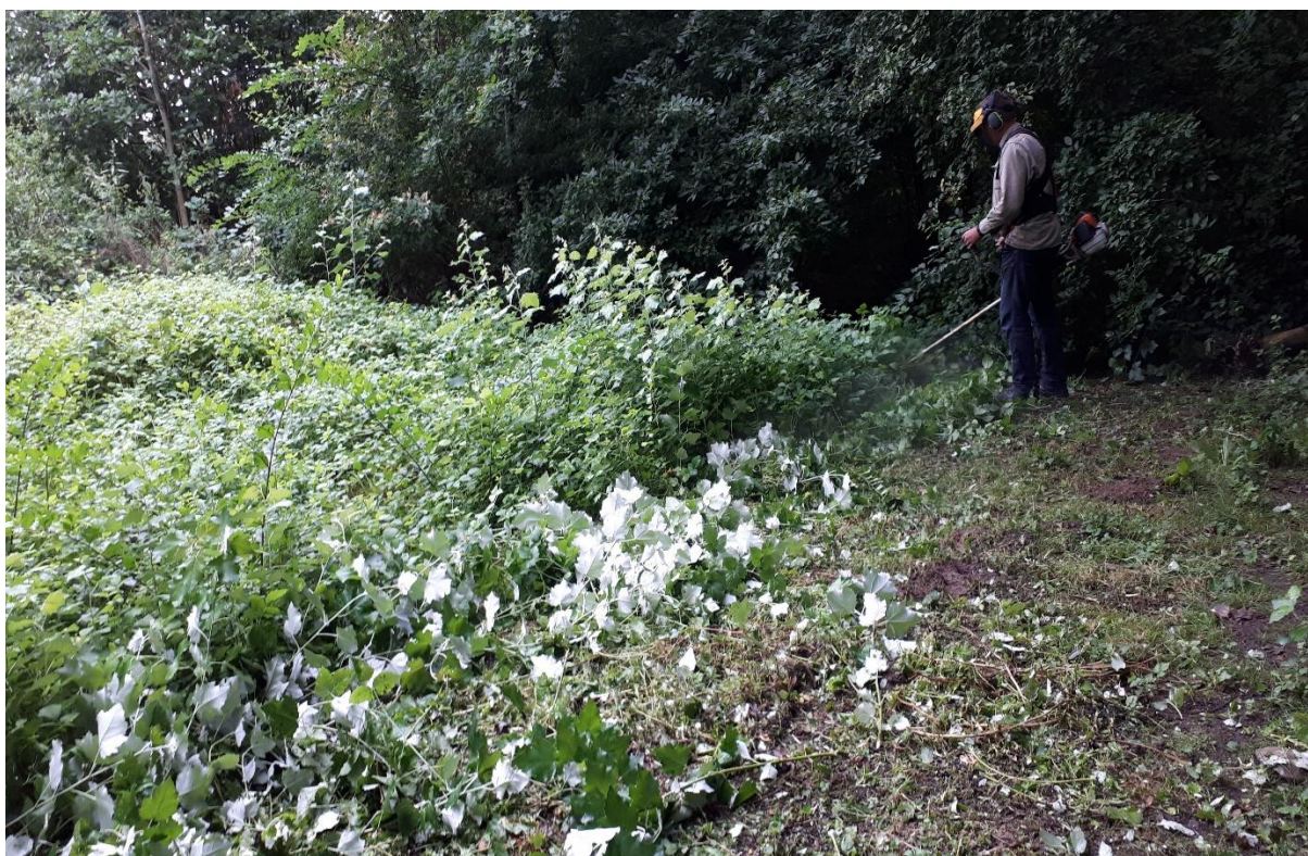
De Bedauwde Braam en het Abelen opschot wordt met de bosmaaier gemaaid.

In tegenstelling tot de hitte van de maand juli was het de afgelopen tijd wisselvallig weer. De regen viel af en toe met bakken uit de hemel. De temperatuur lag nu beneden de zomerse waarden. Was de weersverwachting eerst qua regen voor zaterdag nog onzeker, was het op deze werkochtend droog. Met een graad of 20 was het heerlijk weer om alle beheeractiviteiten te doen.