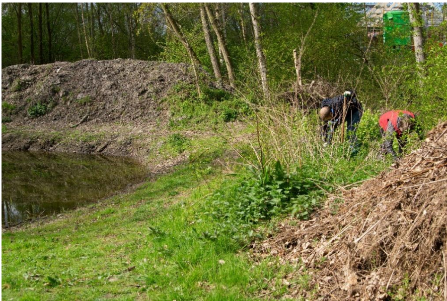
Kruiden wieden zodat de jonge aanplant de ruimte krijgt.