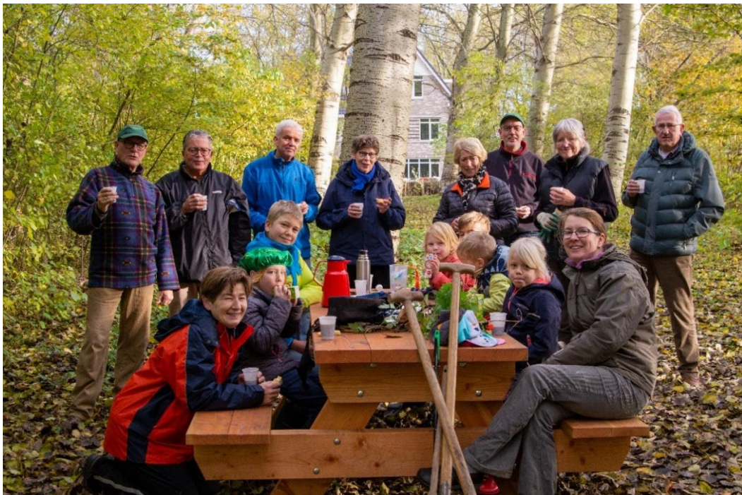
Na hard werken dronken we koffie bij de nieuwe picknickbank.