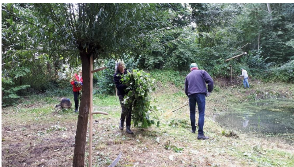
Rondom de poel wordt gemaaid. Het maaiafval gaat naar de broeihoop voor een Ringslang.