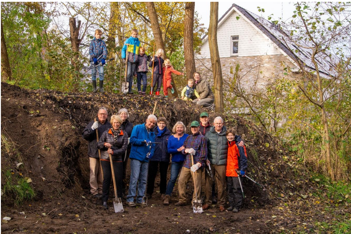
Alle vrolijke vrijwilligers in het "zuinige" herfstzonnetje.