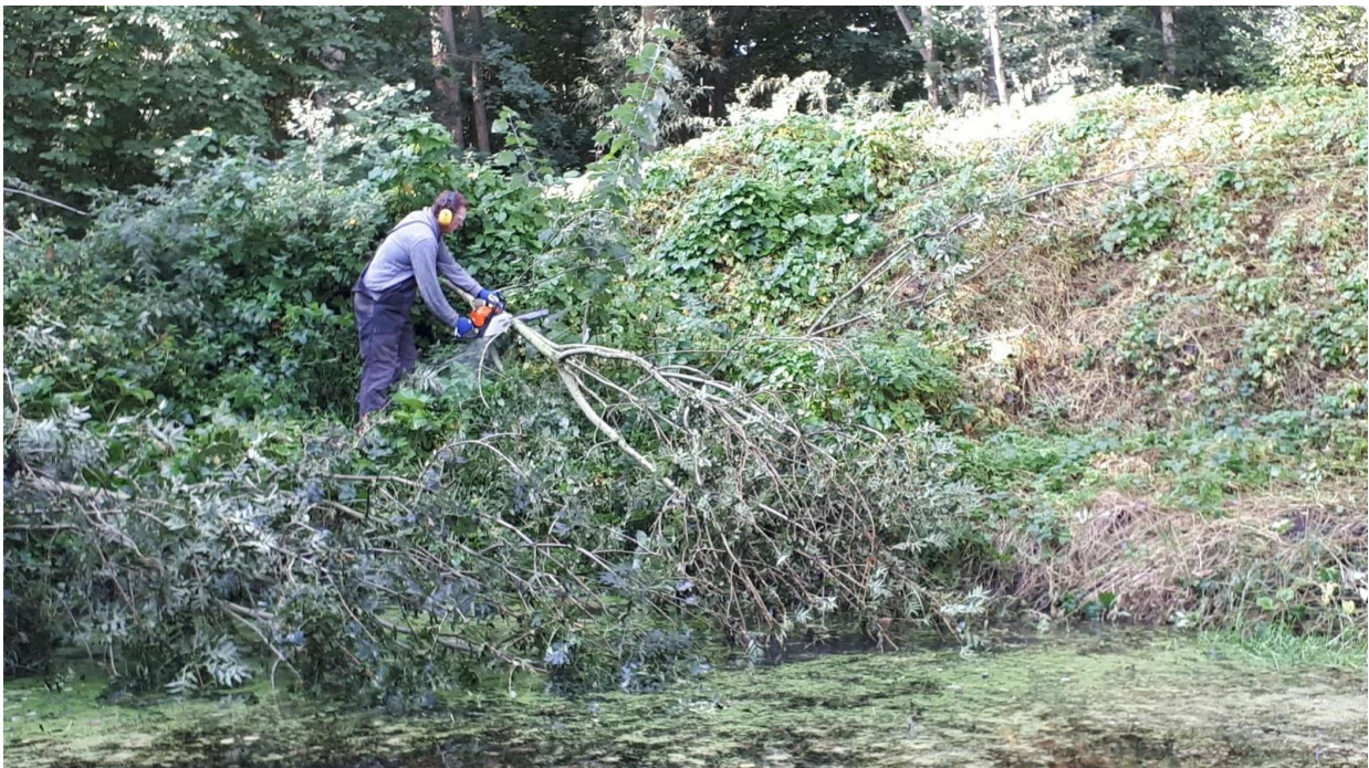
De omgewaaide Es wordt met de kettingzaag in stukken gezaagd.

De foto's geven een beeld van hoe hard er gewerkt is .