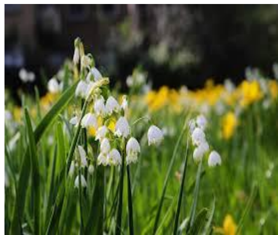
Lenteklokjes ( Leucojum vernum ) familie van de narcis familie, bloeien.