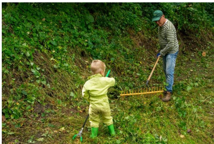
“Jong geleerd, oud gedaan”