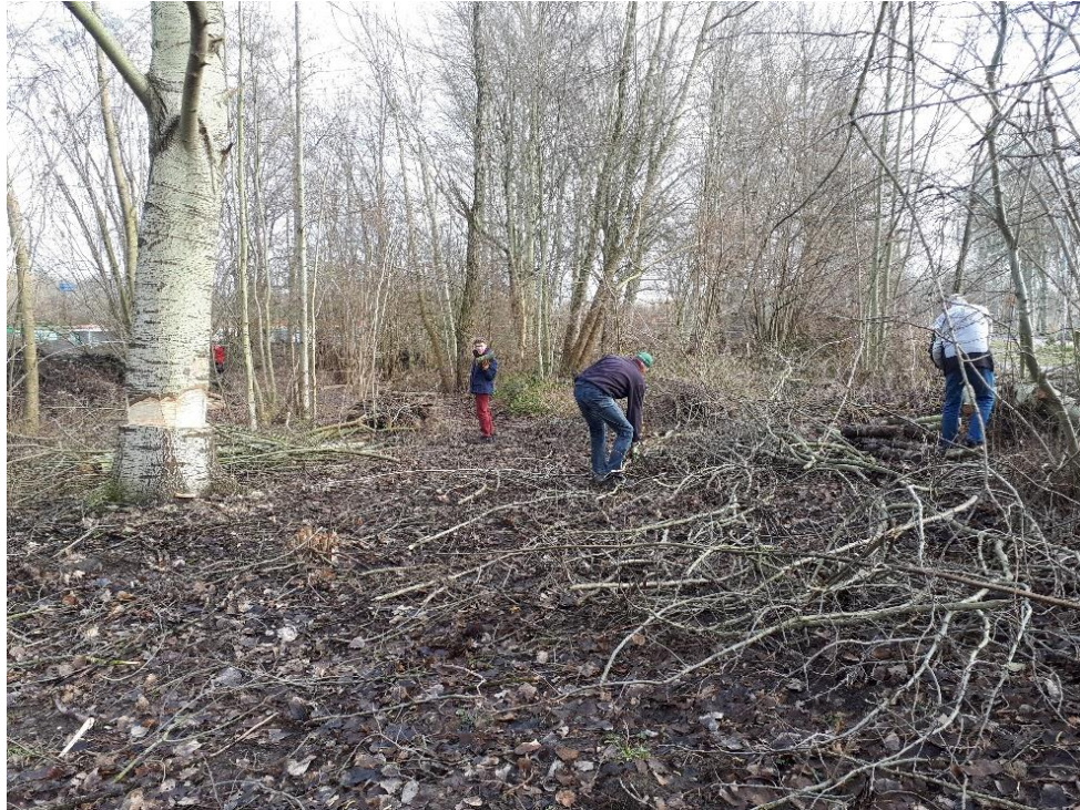
De laatste “loodjes”; de resterende takken van de Abeel worden opgeruimd.