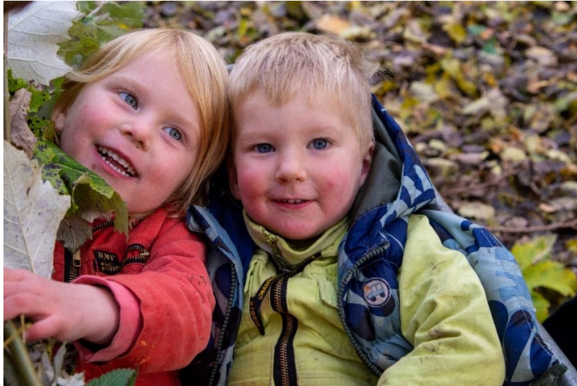
De jongste vrijwilligers.