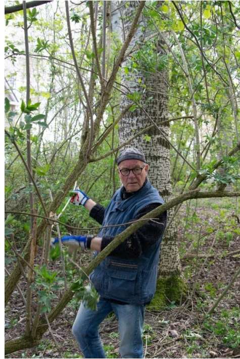
Bosrank verwijderen uit de Kornoelje en de Vlier bij de Abelen.