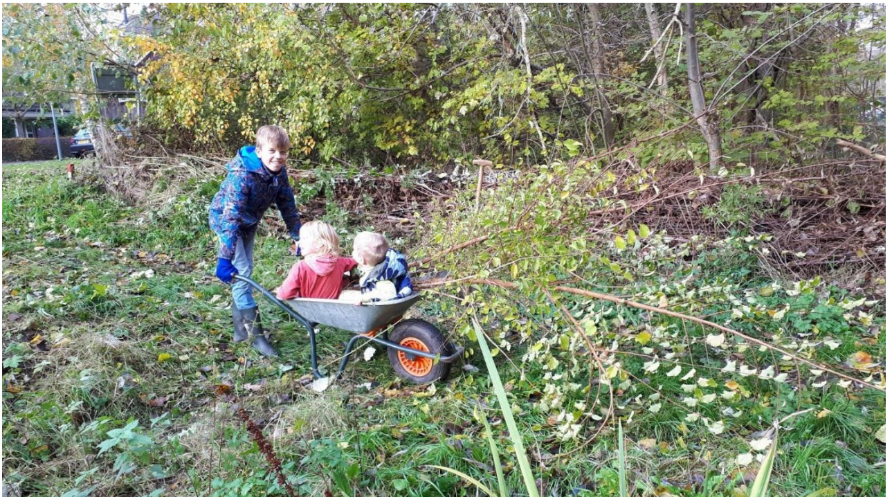
De kruitwagen kan ook splendorwijs z'n dienst bewijzen.