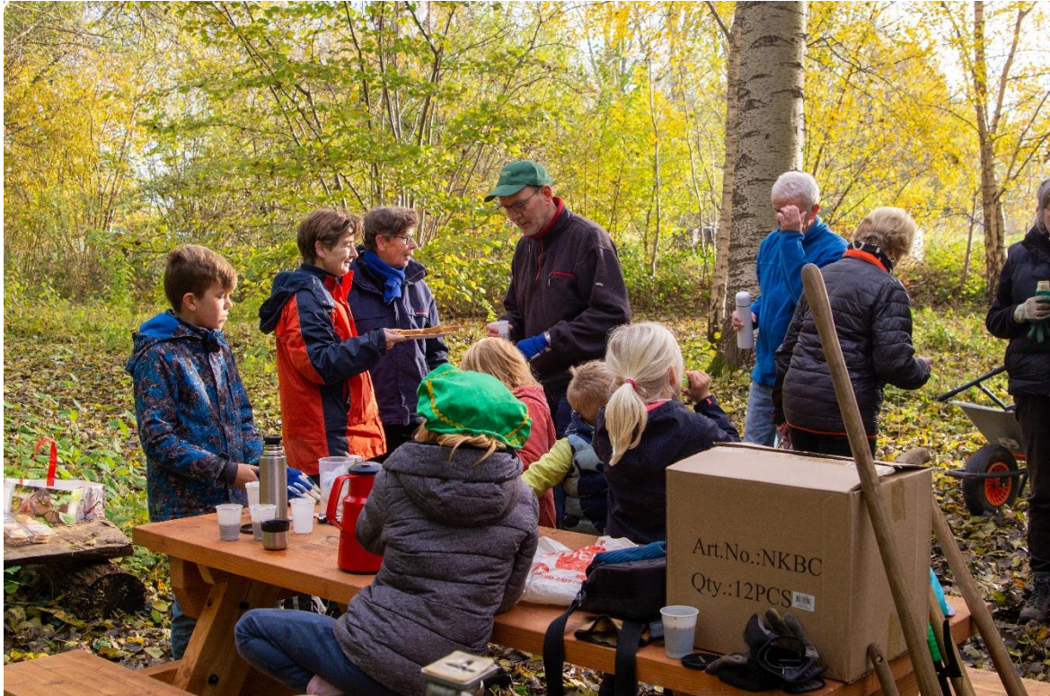
We werden getraceerd op een heerlijke, eigen gebakken plak cake!