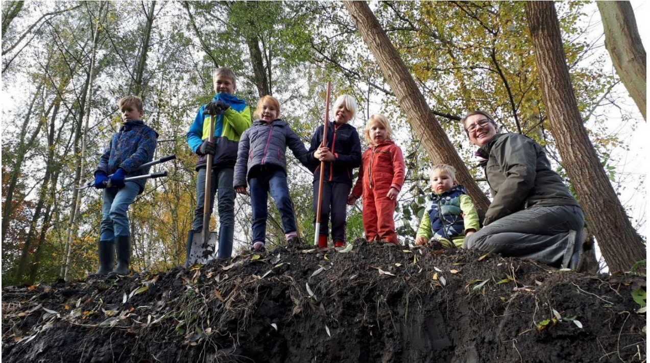
Hoe de “kleinere” vrijwilligers van Kronkelveld groot kunnen zijn.