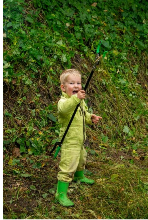
Zwerfvuil pikken. Na een paar weken opnieuw een zak vol, "Jippie"!