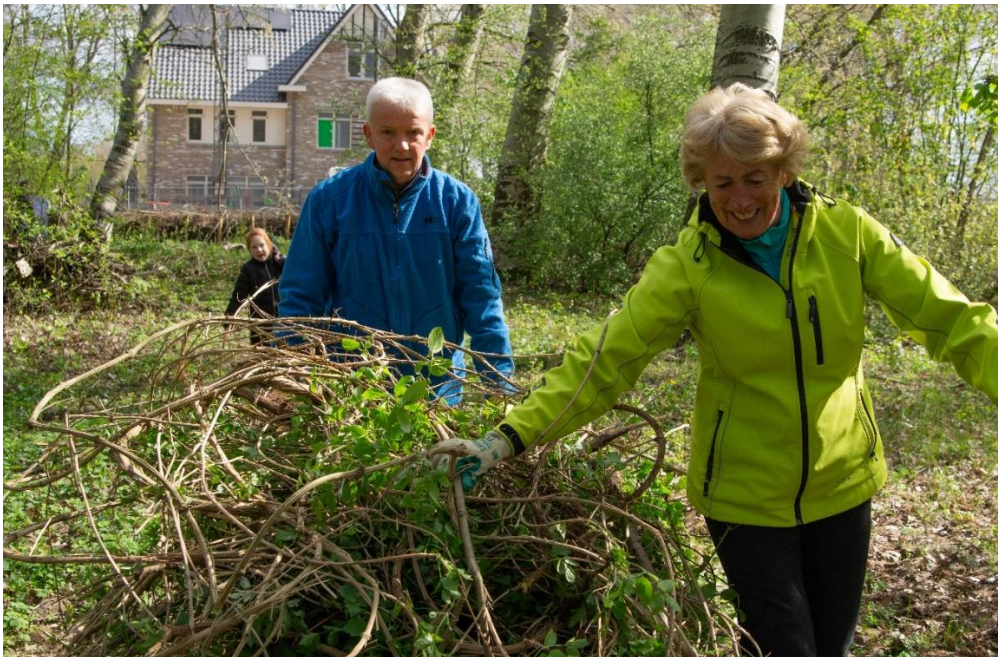
De Bosrank wordt uit Kronkelveld verwijderd en naar de bladkorf aan de Meerveldstraat gebracht.

De bodemstructuur van het veldje met de Bedauwde Braam zorgt ervoor dat het zaad van wilde bloemen niet tot ontwikkeling komt. Om in het voorjaar de bijen en hommels van een extra voedselbron te voorzien, is het idee geopperd om op die plek in het najaar fruitbomen te plaatsen en elders in Kronkelveld nog meer verwilderingsbollen te poten.