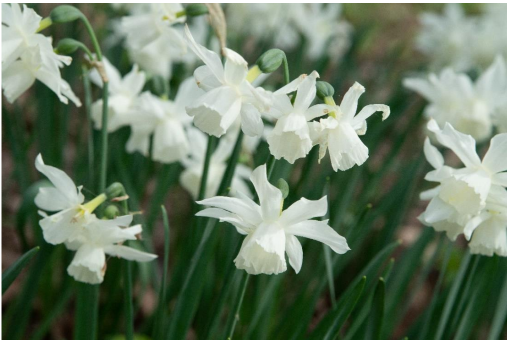
De Thalia Narcis bloeien in het zonnetje.

Het was koud aan het begin van deze werkdag. Het had licht gevoren. Met een matige noordoostelijke wind werd het op deze dag niet warmer dan een graad of 8. Er is weer licht bij de jonge aanplant en tussen de struiken bij de Abelen gekomen. Licht bevordert de diversiteit van alle soorten groen in Kronkelveld.