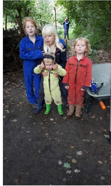
Het dicht gegroeide pad door Kronkelveld is flink onder handen genomen.