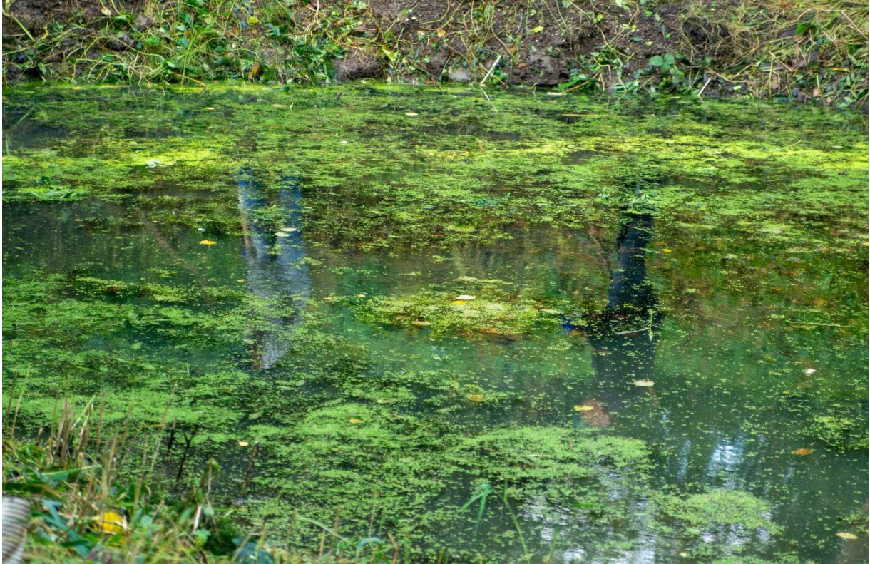
Spiegeltje, spiegeltje aan de wand wat is het mooiste van het land?