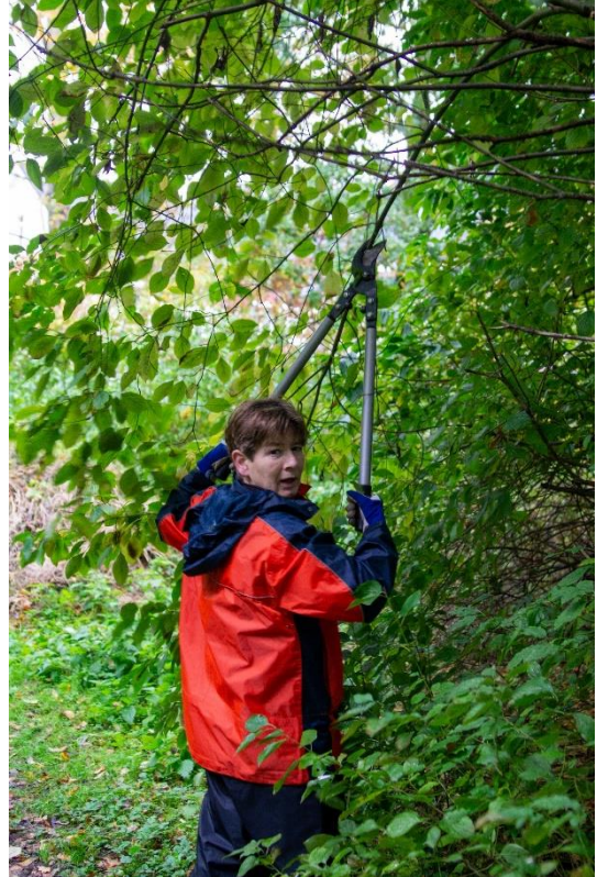
En zij snoeiden vlijtig voort.