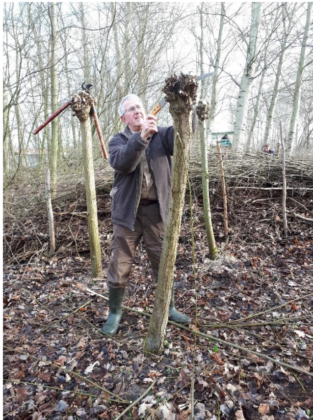
Onze nieuwe vrijwilliger.