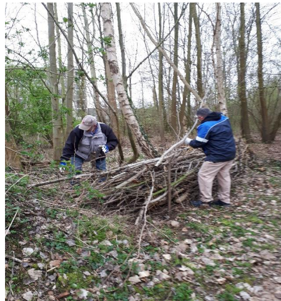
Een nieuwe takkenril wordt achter de wand van de poel gemaakt.