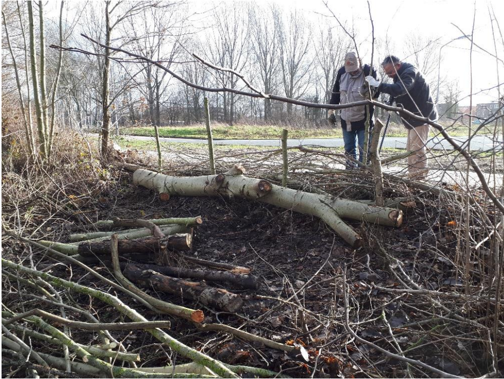
Aan de Meerveldstraat wordt de nieuwe takkenril gemaakt.