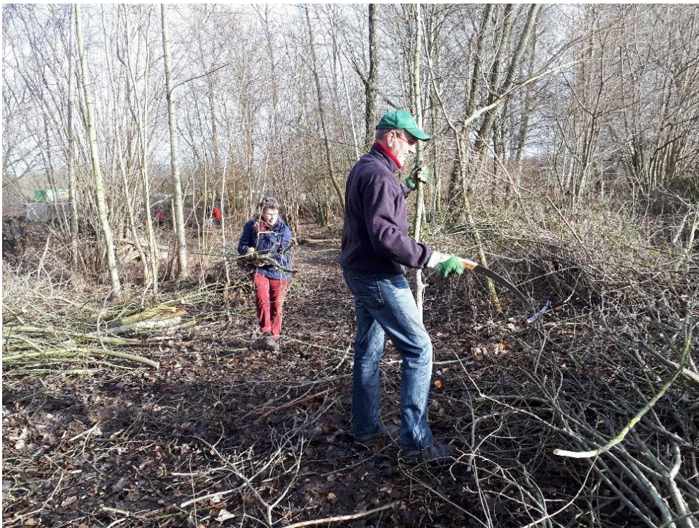
Takken van de gekandelaberde Abeel worden op maat gezaagd en opgeruimd.