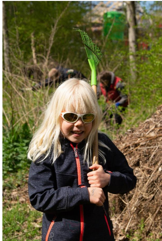
Zwerfvuil is tussen de bosschages weggehaald.